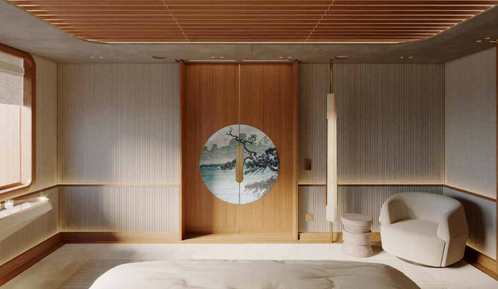
QUI SOPRA E A DESTRA DUE VISTE DELLA CAMERA ARMATORIALE CHE METTONO IN LUCE LA GRANDE CURA NEI DETTAGLI E IN PARTICOLARE IL SAPIENTE USO DEI MATERIALI DI RIVESTIMENTO DELLA GRANDE OWNER SUITE; ESSENZE E TEXTILE RICHIAMANO IN MODO EVIDENTE LA NATURA. NELLA PAGINA ACCANTO, IN BASSO, NON SONO DA MENO LA BELLEZZA, LA CURA E LA LUMINOSITÀ DELLA SPAZIOSA CABINA OSPITI, UNA DELLE TRE CON LETTO MATRIMONIALE CUI SI AGGIUNGONO ALTRE DUE CABINE CON LETTI SINGOLI TUTTE SUL PONTE INFERIORE