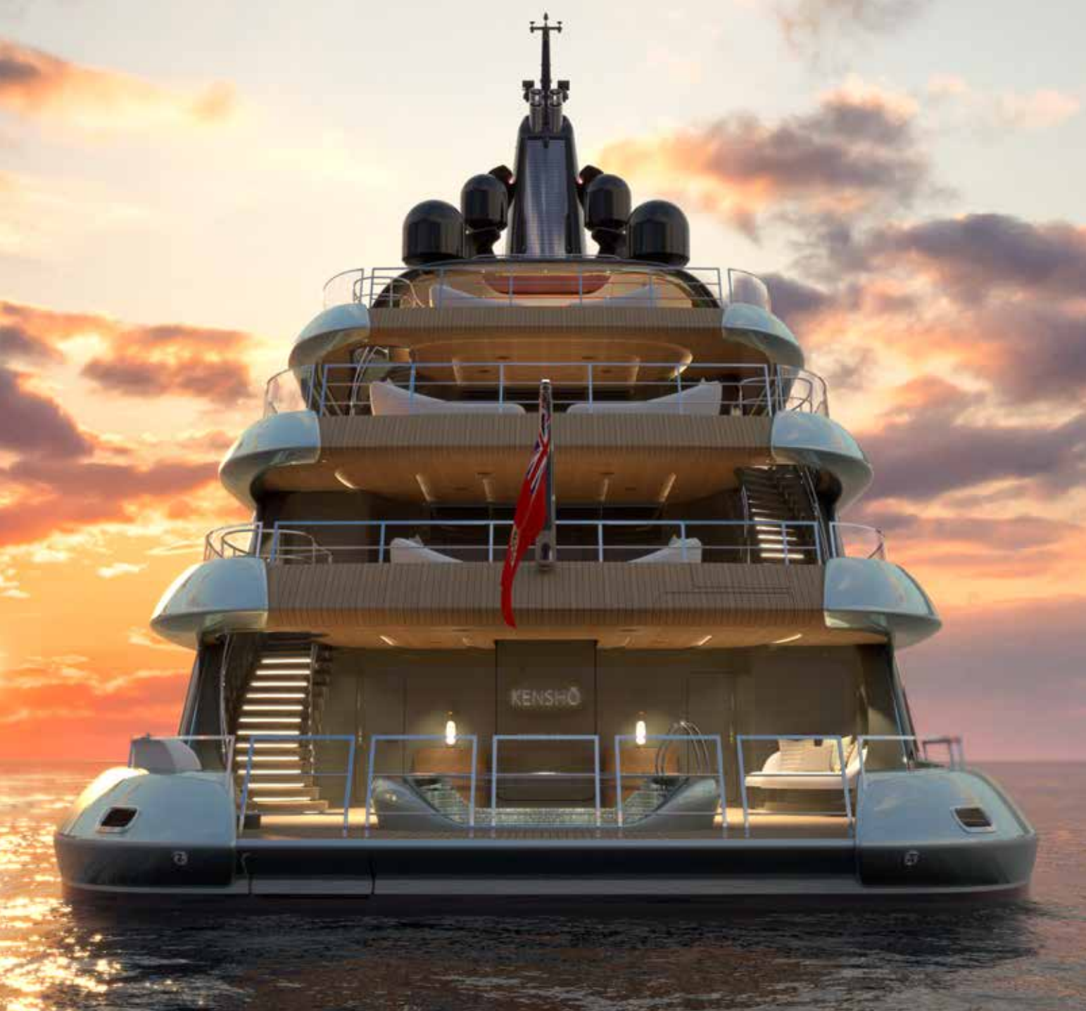
IN APERTURA L'ADMIRAL KENSHO IN NAVIGAZIONE, L'IMMAGINE METTE IN RISALTO LE BELLE LINEE TESI ESTERNE SVILUPPATE DA AZURE YACHT DESIGN INSIEME A ARCHINEERS.BERLIN. ORMAI IMPRESCINDIBILI SONO I PARAPETTI TRASPARENTI IN MURATA (MENTRE, FOTO QUI SOPRA, A POPPA DI TUTTI I PONTI SI RICORRE A DRAGLIE IN METALLO), PER IL MASSIMO PASSAGGIO DELLA LUCE SOLARE E IL CONTATTO VISIVO COSTANTE CON L'AMBIENTE MARINO. NELLA PAGINA ACCANTO, LA SPLENDIDA PISCINA IN COPERTA E LE AREE LIVING/DINING OPEN-AIR A POPPA DEL PONTE SUPERIORE

Che The Italian Sea Group sia un costruttore di bellezza e soprattutto di bellezza innovativa è ormai arcinoto in tutto il mondo. Non stupisce, dunque, che anche un 75 metri (74,85 fuori tutto) come l'Admiral Kensho non sfugga all'imperativo di essere speciale. Per dirlo con le parole del team dell'armatore "ridefinisce i confini di spazio, distribuzione e lusso sui superyacht". Giusto qualche "pillola" per capire quanto Kensho detti le nuove regole del lusso: ogni ambiente interno ha soffitti alti 2,70 metri; la piscina posata sulla spiaggia a poppa misura la bellezza di 22,3 metri e ha sponde trasparenti sicché nuotare in questa grande vasca lascia crede di farlo direttamente in mare; manco a dirlo, adotta un sistema propulsivo "diesel-elettrico", con motori elettrici a magneti permanenti che garantiscono un'alta efficienza e una forte potenza, con volumi limitati. A conferma dell'attenzione all'eco-sostenibilità, ci dicono che: "Il design è stato sviluppato dando molta importanza all'aspetto ambientale, non solo nel rispetto della notazione 'ECO' dell'Ente di Classifica, fornendo al sistema di propulsione cinque generatori a velocità variabile, tutti muniti di sistemi antiparticolato per ottimizzare il consumo a qualsiasi regime e ridurre le emissioni nell'atmosfera. Inoltre, lo scafo è stato sviluppato minimizzando la resistenza attraverso l'uso della propulsione azimutale e alette di stabilizzazione retraibili. E non è certo finita qui".